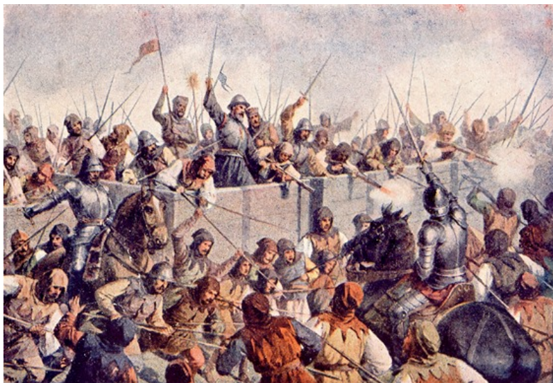
V bitvě u středočeských Lipan se v roce 1434, deset let po Žižkově smrti, střetli husitští radikálové (tedy sirotci a táborité) a aliance umírněných husitů – kališníků, husitské šlechty a katolíků. Radikálové drtivě prohráli, v bitvě padl i jejich vůdce Prokop Holý.

V podstatě ano, měl slušný dům v Praze, ale s penězi to asi opravdu neuměl, tak velký dům prodal a pořídil si malý domeček. Měl svůj klid a blížil se šedesátce, což byla hranice stáří.