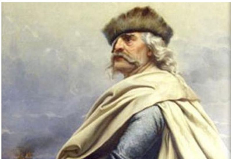
Jan Žižka z Trocnova