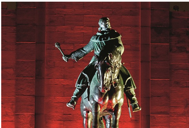
Pomník má husitský hejtman v Česku velkou řadu. Na snímku je slavnostně nasvícený bronzový pomník na pražském Vítkově.