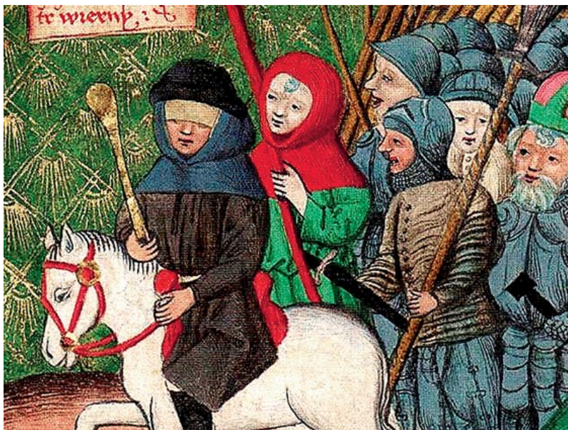
Husitský velitel – tentokrát již slepý na obě oči – v čele svého vojska na ilustraci v Jensském kodexu z přelomu 15. a 16. století.