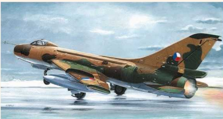
➤ Jedním z nosičů taktických jaderných zbraní ČSLA byl stíhací bombardér Suchoj Su-7B