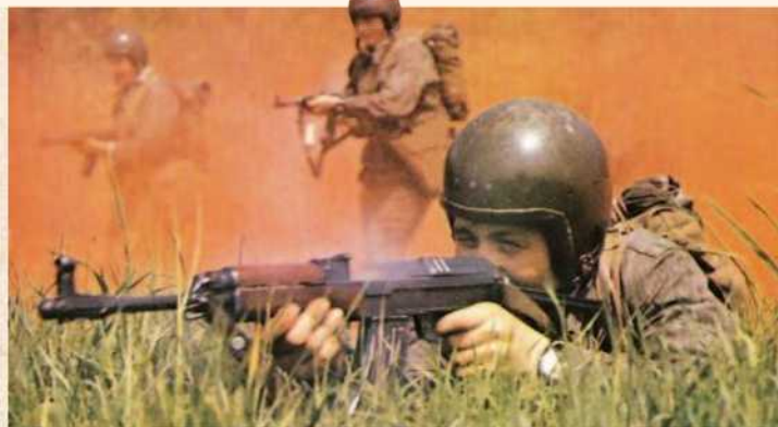
➤ Českoslovenští výsadkáři vyzbrojení útočnými puškami Sa 58 při cvičení

Československý front postupoval přes francouzskou hranici a v intencích plánů sovětského generálního štábu dosáhl linie Besançon–Belfort. Cvičení počítalo se svržením 130 jaderných bomb.